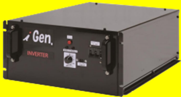
三相インバーター 最大10kVA